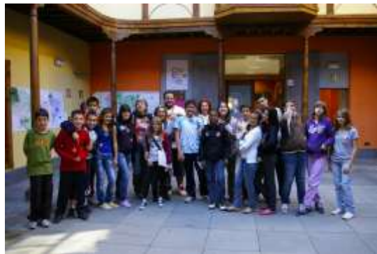
Visitas a la Casa de Juventud