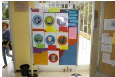
Punto de Información Juvenil