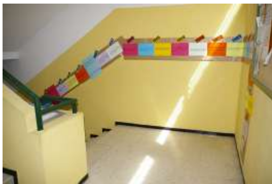
Tiempos de Igualdad