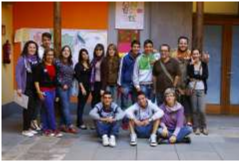
Visitas a la Casa de Juventud